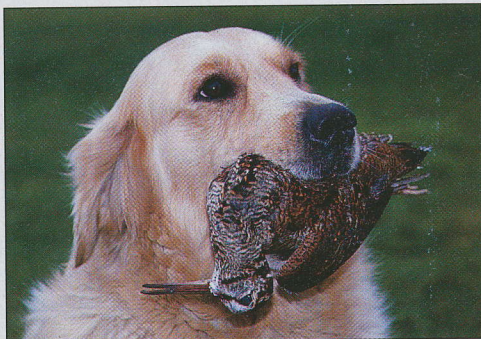
Un raro Golden retriever. Tutti i cani impiegati per la caccia alla beccaccia sono addestrati a riportare immediatamente, senza troppi comandi.