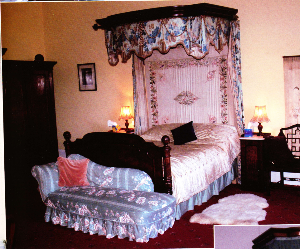
interno del castello di Casa Rizzini

particolare come in origine. Grandissimi soggiorni, biblioteca, sala da pranzo, sala dopo cena, e soprattutto le 6 camere da letto veramente come le piazze d'armi arredate con gli originali mobili. La scalinata che ci porta al piano notte poi e' tutta attornata con dei dipinti raffiguranti gli antenati proprietari. Il tutto molto confortevole e tenuto in ottimo stato di conservazione.