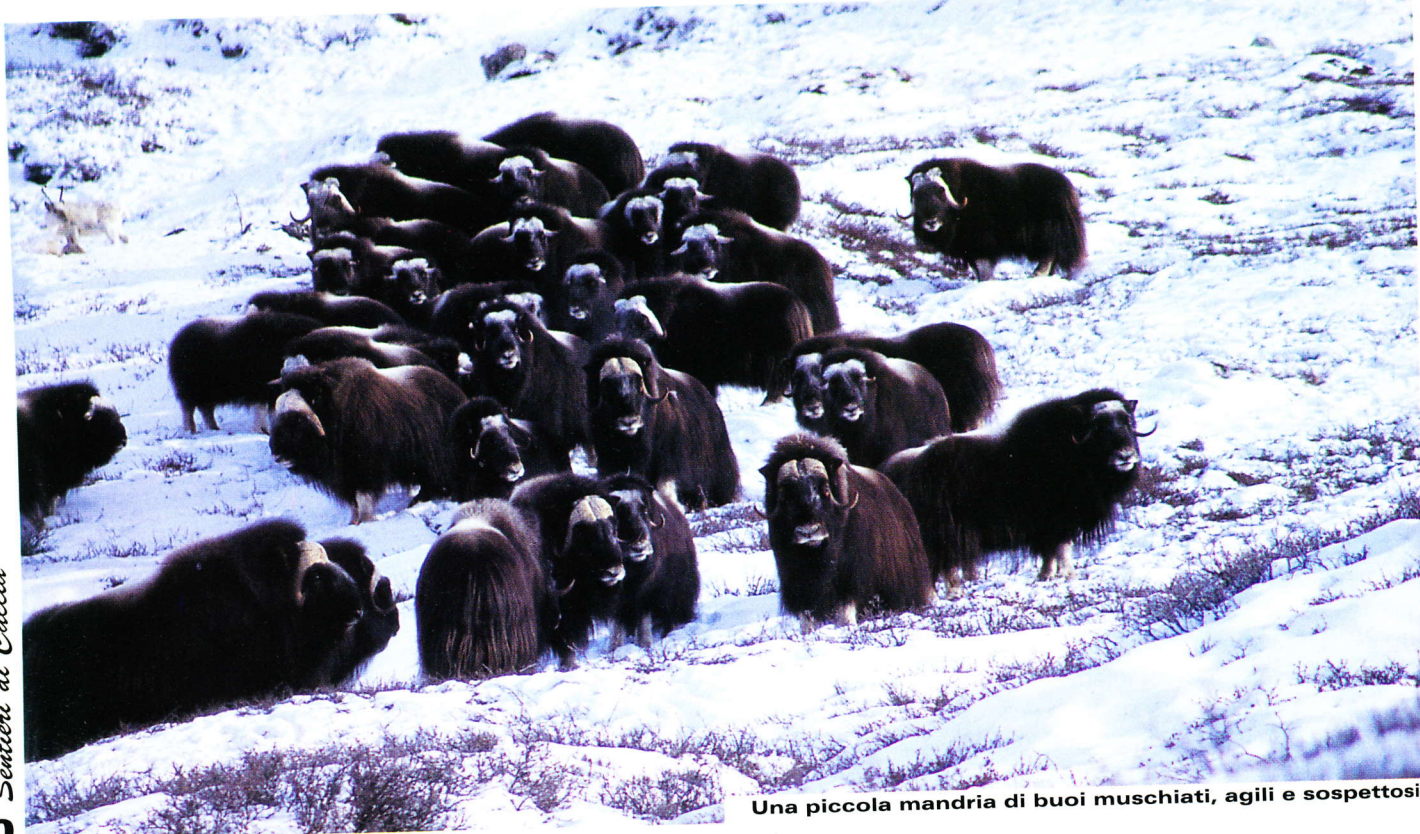
Una piccola mandria di buoi muschiati, agili e sospettosi