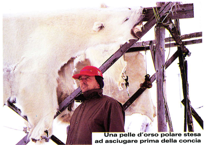
Una pelle d'orso polare stesa ad asciugare prima della concia