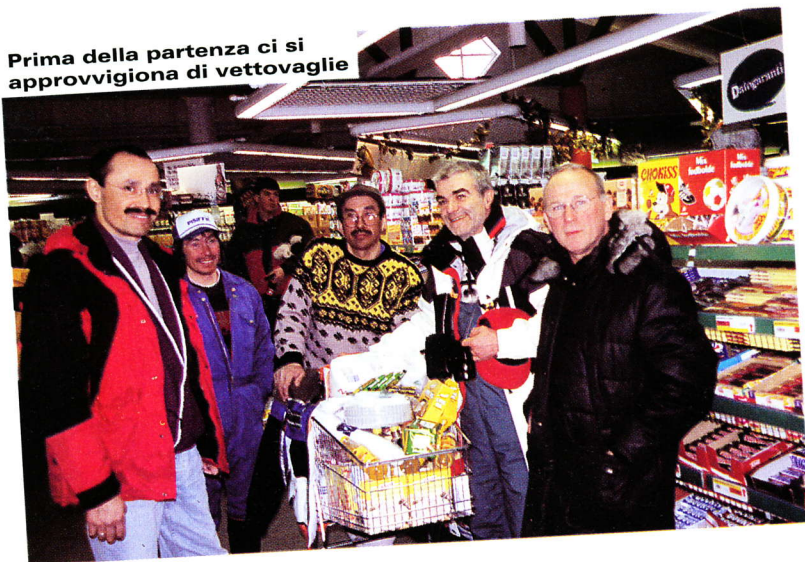
Prima della partenza ci si approvvigiona di vettovaglie

una potenza fisica notevole, di un' adattabilità alle intemperie altrettanto sorprendente e di un'obbedienza che si è rivelata in più occasioni veramente di vitale importanza. Ogni muta ha il capo branco che solitamente è posizionato in centro e più avanti degli altri. Sembrano cani molto docili e di un mansueto aspetto, ma non sono animali domestici, discendono direttamente dal lupo della Groenlandia e conoscono un solo capo: il loro padrone. A noi è stato vietato avvicinarsi in quanto possono essere pericolosi. Attraversiamo fiordi ghiacciati, colline, il paesaggio è eccezionale ed il sole ci accompagna, di fronte a noi una costa molto ripida, le guide scorgono qualche cosa muoversi, è un branco di bianche sono a 70-80 metri da noi. Si crea un po' di confusione e si involano, un altro branco si unisce a loro, si alzano sopra la cresta ed un altro branco si unisce ancora. Le vediamo per qualche secondo e sono più di 60, ri-