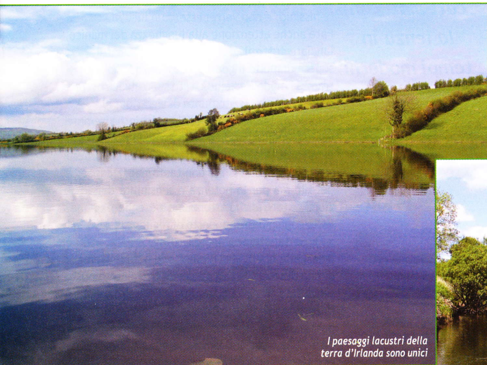
I paesaggi lacustri della terra d'Irlanda sono unici

Pescherete in posti diversi e con profondità diverse, e quando sotto di voi ci saranno quattro o sei metri d'acqua, provate sul fondo, ma non fossilizzatevi: soprattutto in stagione avanzata (da aprile in poi) il pesce può trovarsi "sospeso" anche su alti fondali; a me è capitato, sia trainando sia lanciando, e può essere difficile. Per cui ricordatevi di sondare tutti gli strati.